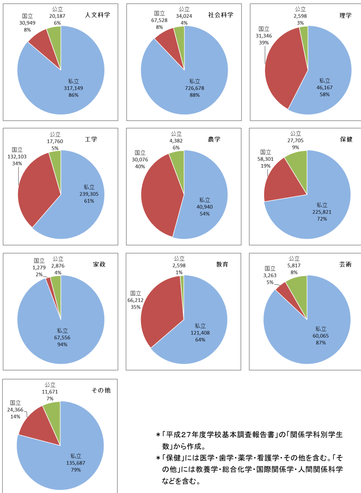
【図表3】学部系統別学部学生数の比較

工系学部が多いことにもとめる見方もある。しかし、学部系統別の学生数とその割合を比較してみると、【図表3】の円グラフのようになっており、すべての学部系統で私立大学生数が国立を大きく上回っていることは一目瞭然である。